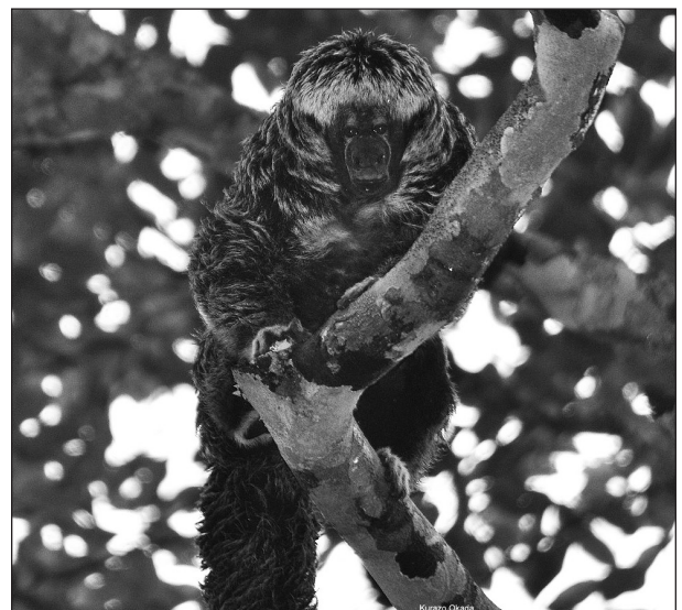
Figura 2. Indivíduo de Pithecia irrorata observado em Chupin-guaia-RO.

Os registros apresentados no presente estudo foram obtidos em dois inventários independentes de primatas no estado de Mato Grosso (Fig. 1). Nesta região, a vegetação natural é composta por florestas tropicais úmidas, florestas de transição e manchas de cerrado nas porções mais meridionais (RADAMBRASIL, 1978; Daly e Prance, 1989). Contudo, as atividades humanas alteraram significativamente esta paisagem nas últimas décadas (Fearnside, 2005). O primeiro sítio de amostragem está localizado no município de Brasnorte (Sítio # 1: 12°32'S, 57°52'W). Dezenove incursões foram realizadas durante todos os finais de semana, no período de fevereiro a junho de 2009, em três fragmentos florestais situados em torno da Pequena Central Hidrelétrica Bocaiúva, com extensões de 306, 450 e 600 hectares. Caminhadas aleatórias em trilhas já existentes, bem como em bordas de mata e estradas de terra no interior dos fragmentos foram realizadas. O período de amostragem de campo/final de semana foi de 24 horas. O esforço total de amostragem