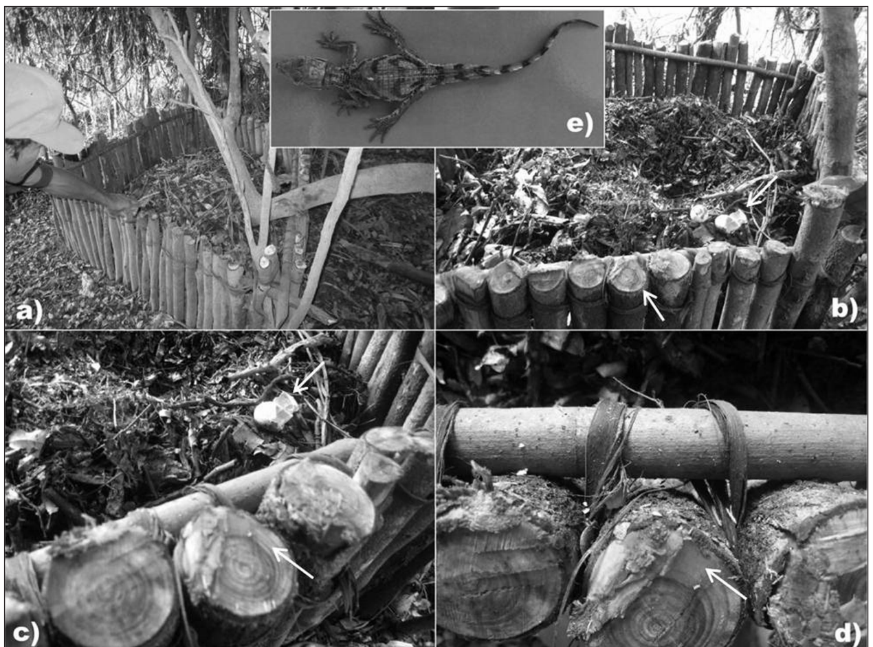
Figura 2. Imagens do ninho de Caiman crocodilus possivelmente predado por Saimiri sp. na comunidade Ilha do Carmo, Alenquer (PA): a) ninho no dia anterior à predação; b), c) ninho com indícios de predação; d) estaca do ninho com marcas de sangue e fragmentos de casca do ovo; e) recuperação de filhote de C. crocodilus após alguns dias do ferimento.